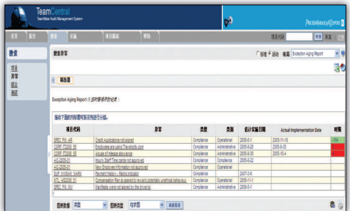
TeamCentral 图示 1 – 在 TeamCentral 中搜索所有审计项目中包括的合规类审计发现